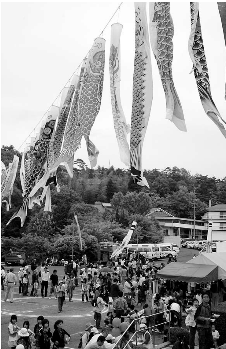
薫風の中を“山のぼり”する約150匹の鯉のぼり

発行：黒住教本部 岡山市北区尾上神道山 TEL：086-284-2121 FAX：086-284-4756 http://www.kurozumikyo.com/