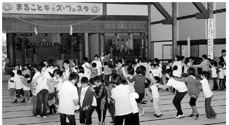
大教殿の教場でゲームを楽しむ子供達

バーベキューの夕食を口いっぱい頬張っていました。夕食後は寸劇「宗忠さま」を観劇、映像と実演を交えたクイズ形式の寸劇に解答者も頭をひねり、続いているビンゴ大会では大興奮。